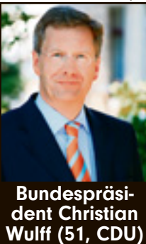
Bundespräsident Christian Wulff (51, CDU)

Saarbrücken - Diese jungen Leute haben richtig was auf dem Kasten, imponieren sogar Bundespräsidenten Christian Wulff (51, CDU): Die Kandidaten des „Leistungswettbewerbs der saarländischen Handwerksjugend 2010“. Eine Aktion der Handwerkskammer unter der Schirmherrschaft unseres Bundespräsidenten.